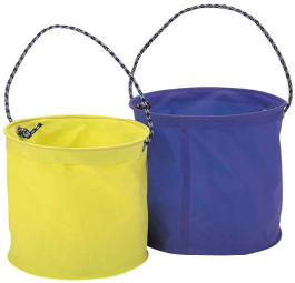
折りたたみバケツ

上記の①～③なしでも(素手でも)潮干狩りは出来ますが、素手で砂をかいていると指先が痛くなります。特に低学年児童はまだ皮膚が柔らかいので痛みやすいです。